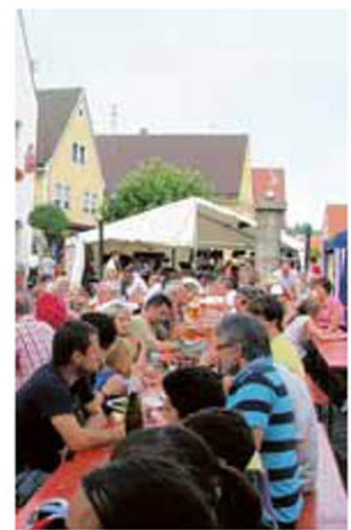
Erfahrungen mit Bewirtung und Bühne auf dem Krumbacher Marktplatz (im Bild die KRU-Party im Jahr 2012) gibt es reichlich. Vereine nutzen den Bereich zum Beispiel beim Maibaumaufstellen oder im Fasching, und auch die Werbegemeinschaft ist dort immer wieder mit Aktionen zugegen.

Mit dem Programm möchten die Organisatoren alle Generationen ansprechen. Die junge Generation soll verstärkt auf sozialen Netzwerken